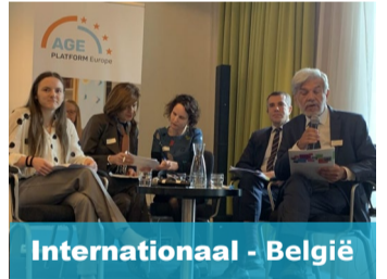
Internationaal - België